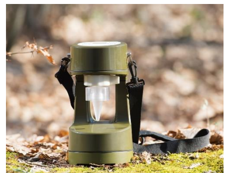
Biocollecteur Coriolis Compact

Pour accompagner les équipes NRBC et les primo-intervenants en cas de suspicion d'agents pathogènes, Bertin a développé la gamme Coriolis, des biocollecteurs portables et résistants permettant de prélever les particules biologiques dans l'air et de les concentrer dans un échantillon compatible avec toutes les méthodes d'analyse. Associées au nouveau kit de détection qPCR tout-en-un – Biotoxis - qui repère et identifie simultanément les trois principaux agents de la menace biologique (B. anthracis, Y. pestis et F. tularensis), ces solutions permettent l'obtention d'une réponse rapide et fiable pour une intervention immédiate en cas d'attaques biologiques avérées.