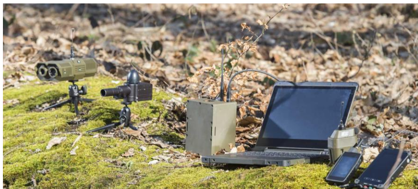
Réseau de capteurs autonomes (UGS)

Exensor, filiale de Bertin Technologies (Groupe CNIM), et son partenaire Siltec ont été sélectionnés par le Ministère polonais de la Défense pour la fourniture de 116 réseaux de capteurs autonomes (Unattended Ground Sensors - UGS) destinés à des missions de reconnaissance et de collecte de renseignements.