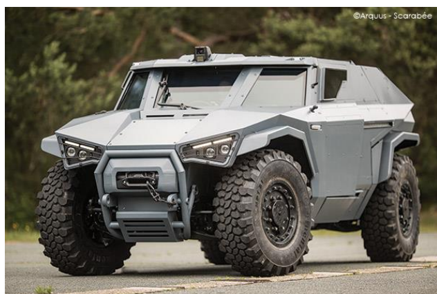
Module PeriSight de vision périmétrique intégré

Bertin Technologies offre également des solutions optroniques longue-portée , telles que PeriSight. Destiné aux intégrateurs pour des applications terrestres et maritimes, PeriSight est un réseau de boîtiers caméra pour véhicules blindés ou systèmes de sécurisation de sites critiques , permettant une visualisation thermique et couleur BNL longue-portée (jusqu'à 5 km avec PeriSight Zoom) afin d'améliorer significativement l'appréhension des situations de terrain.