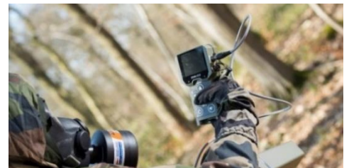
Radiamètre multisondes SaphyRAD MS

- Le SaphyRad MS , radiamètre multisonde spécialement conçu pour les équipes NRBC* et HAZMAT** . Doté d'un design robuste et d'une interface ergonomique pour une utilisation simplifiée même en environnement hostile, cet équipement permet d'effectuer les premiers contrôles , notamment sur les personnes et/ou les véhicules, de localiser en temps réel les sources radioactives et de mesurer la contamination sur toutes les surfaces .