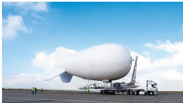
Ballon captif Condor

Capables d'embarquer des charges utiles allant jusqu'à 250 kg (ballon captif de type Condor), les ballons captifs CNIM Air Space peuvent embarquer tous types de capteurs (caméra EO/IR, antennes relai, radar, etc.) afin de transmettre au sol des informations fiables et indispensables à la prise de décision.