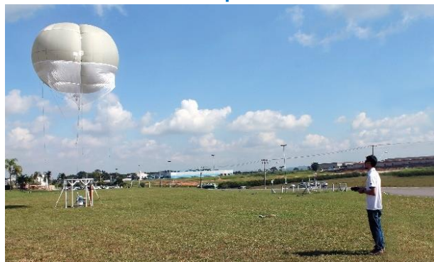
Ballon captif White Hawk

Le White Hawk est un ballon captif elliptique de 40m 3 déployable en 45 minutes par seulement 2 opérateurs. Il peut embarquer jusqu'à 5 kg de charge utile à 200 mètres.